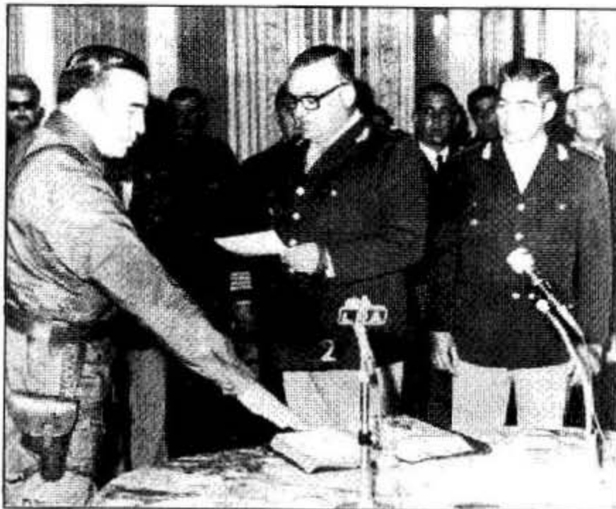
14. Tucumán, avril 1976. Le général de brigade Antonio Domingo Bussi (à gauche) prête serment lors de sa prise de fonction comme gouverneur de la province de Tucumán, devant le général Albano Harguindéguy, ministre de l'Intérieur de la junte militaire argentine (au centre).

au pied de la lettre les enseignements que nos chefs avaient reçus des Français. Car, à l'époque, les instructions militaires qui venaient des États-Unis étaient conformes à l'expérience américaine au Viêt-nam : c'était des techniques de guerre antiguérilla développées dans la forêt, alors que nous nous entraînions à des méthodes de répression urbaine, dont le modèle était la bataille d'Alger, d'où la place accordée au renseignement, et donc à la torture.