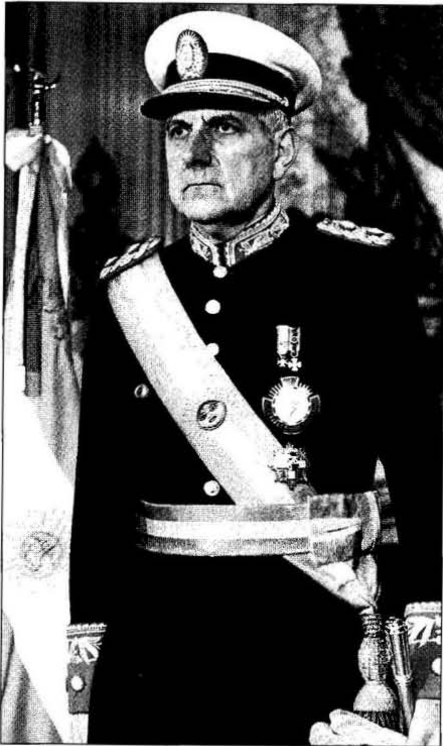
13. Général Reynaldo Benito Bignone. Il a dirigé la junte militaire argentine de juillet 1982 à décembre 1983.