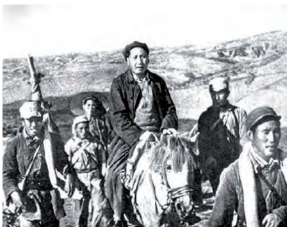
Mao pendant la « Longue marche ».

On comprend dès lors qu'un fils dénonce son père coupable d'avoir murmuré contre le parti, renseigné une patrouille ennemie ou simplement tué une poule dans le village pour améliorer l'alimentation familiale. S'il s'abstenait de le faire, il deviendrait complice et serait lui-même inévitablement dénoncé. La redoutable perversion de ce système, où la délation est érigée en « devoir civique » (ou social), est que le plus grand nombre en vient à considérer qu'il vaut mieux dénoncer le père plutôt que de perdre toute la famille. Chacun étant toujours susceptible d'espionner et d'être espionné, toute cellule organique est rapidement détruite et l'individu est livré sans « défenses naturelles » au pouvoir central.