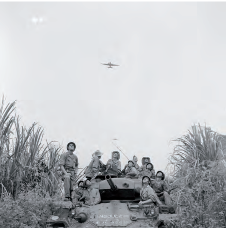
S'affranchir des axes...

ment, être consacrés à l'instruction : sa discipline de feu, ses aptitudes manœuvrières, l'efficacité de son tir sont jugés supérieurs à celles d'autres unités, formées de « vieux » soldats comptant déjà de plus longs états de service. Dans ce contexte, les unités régulières du Viêt-minh, qui passent jusqu'à huit mois sur douze à l'instruction dans ses zones de repli de la rébellion, surclassent en général l'infanterie métropolitaine ou autochtone, surtout dans le combat de nuit, que les Français subissent quand il leur est imposé mais qu'ils ne recherchent guère parce qu'ils ne l'ont pas étudié. « Usure de l'infanterie et manque d'instruction expliquent que nous ne puissions nous passer de la sacro-sainte "combinaison des armes", que nos unités se sentent peu sûres d'elles et aient un rendement médiocre en terrain difficile ».