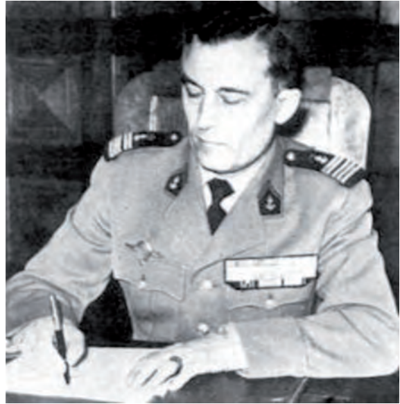
Le colonel Trinquier.

En 1961, trois ans avant la sortie du livre de Galula aux États-Unis, le colonel Roger Trinquier publie La guerre moderne 11 . C'est un ouvrage majeur, écrit par une figure des unités aéroportées. Né en 1908 et mort en 2000, issu de l'école de l'infanterie de Saint-Maixent, ce vétéran de la Seconde Guerre mondiale, de la guerre d'Indochine et d'Algérie est aussi un familier de la Chine et de la Corée. « Praticien quasi instinctif de l'irrégularité, doublé cependant d'un organisateur méthodique », Trinquier livre une « méthode, des procédés et une stratégie complète de la guerre irrégulière », estime l'universitaire François Géré. La stratégie de Trinquier repose sur les quatre facteurs structurants que sont la nature de l'action (offensive/défensive), la population (centre de gravité), le territoire (ami/ennemi) et le temps (urgence/longue durée). Marqué par les progrès du communisme dans l'immédiat après Seconde Guerre mondiale, Trinquier conçoit l'insurrection ou l'action subversive comme un phénomène essentiellement exogène 12 . Présupposant que les territoires